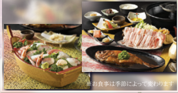
※お食事は季節によって変わります

準組合員様がお申込みの場合、同伴者も準組合員料金でご提供いたします。詳細はお問い合わせください。