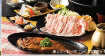
※お食事は季節によって変わります